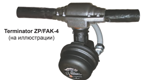
Terminator ZP/FAK-4 (на иллюстрации)

Тип комплекта FAK = комплект для сборки на месте